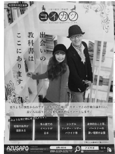
婚活「アズサポ」紹介チラシ

→ 実績ある「アズサポ」や「しあわせ信州婚活サポート」等を活用し、中信地区の結婚支援をリードすべく、今後の取り組みに注目しましょう。